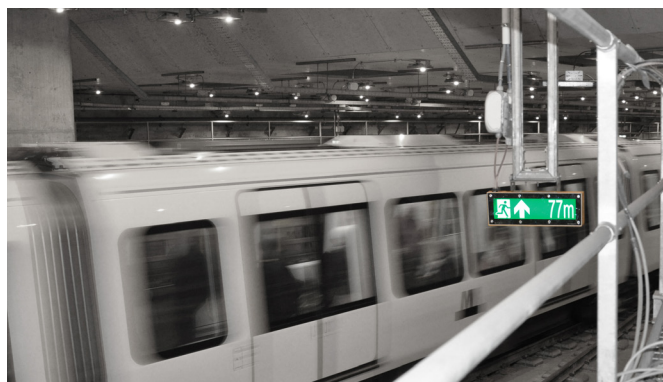
Metro CMT - Cabletray monterad i Cityringen Nyhamn, Köpenhamns Metro.