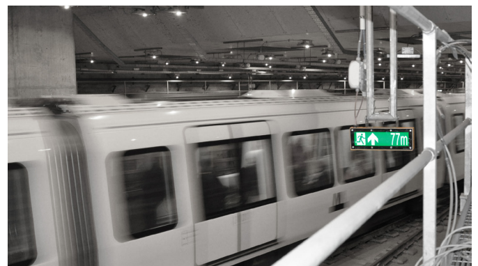
Metro CMT monterad i Cityringen Nyhamn, Köpenhamns Metro.