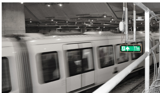
Metro CMT monterad i Cityringen Nyhamn, Köpenhamns Metro.