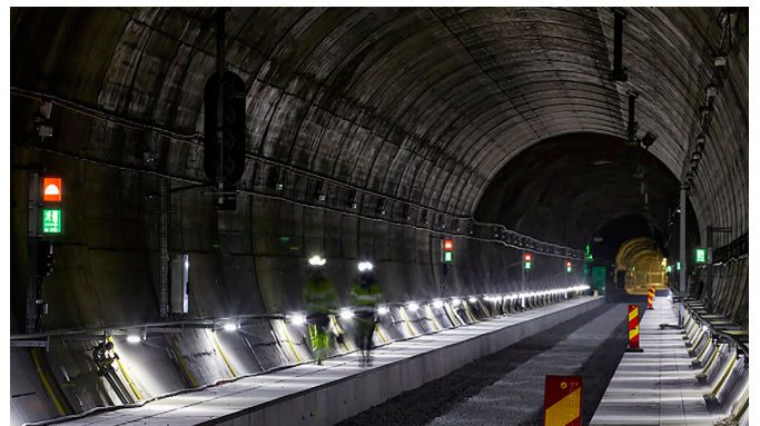
Safety Marker - Green monterad i Hallandsåstunneln.